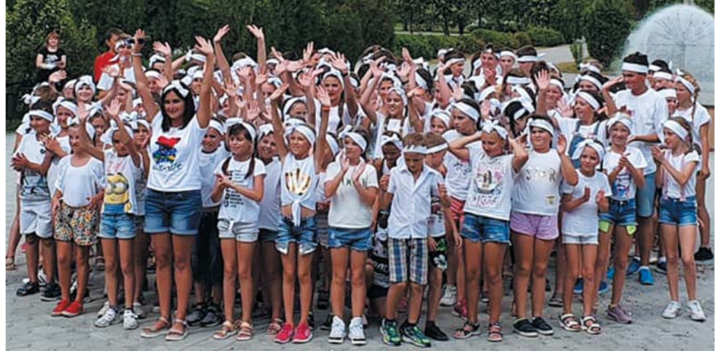
22 серпня у дитячому оздоровчому центрі соціальної реабілітації санаторного типу «Перлина Придніпров'я» (с. Орлівщина Новомосковського району) відбувся форум