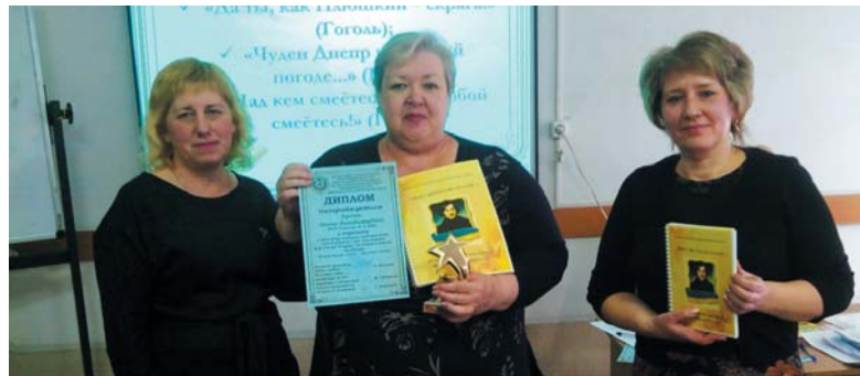
Організатори та переможці конкурсу, присвяченому творчості М.Гоголя

Відповідно до розділу XII «Прикінцеві та перехідні положення» Закону України «Про освіту» визначено, що особи, які належать до корінних народів, національних меншин України і розпочали здобуття ЗСО до 1 вересня 2018 року, до 1 вересня 2020 року продовжують здобувати таку освіту відповідно до правил, які існували до набрання чинності цього Закону.