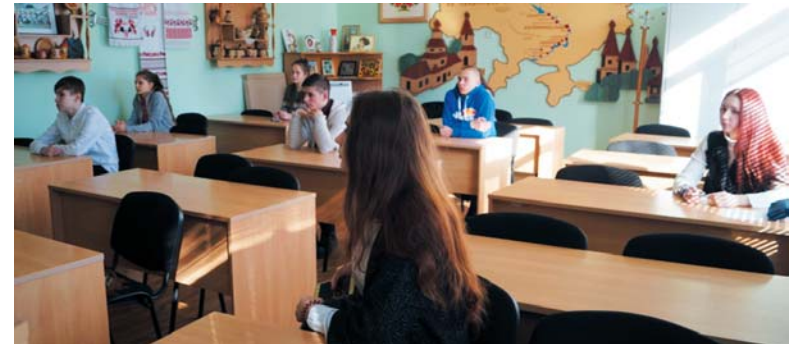
Всеукраїнська учнівська олімпіада з польської мови

Обов'язковому оцінюванню підлягають навчальні досягнення учнів з предметів інваріантної та варіативної складових робочого навчального плану закладу. Не підлягають обов'язковому оцінюванню навчальні досягнення учнів з факультативів, відвідувачів групових та індивідуальних занять, чий досягнення фіксуються в окремому журналі.