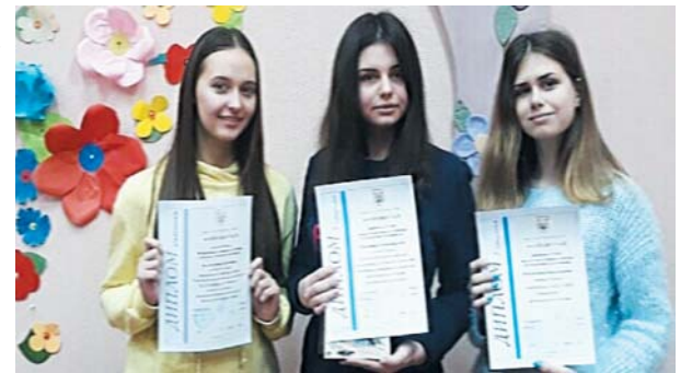
Учасниці IV етапу Всеукраїнської олімпіади з російської мови та літератури

Робочі освітні програми закладів ЗСО затверджуються керівництвом навчального